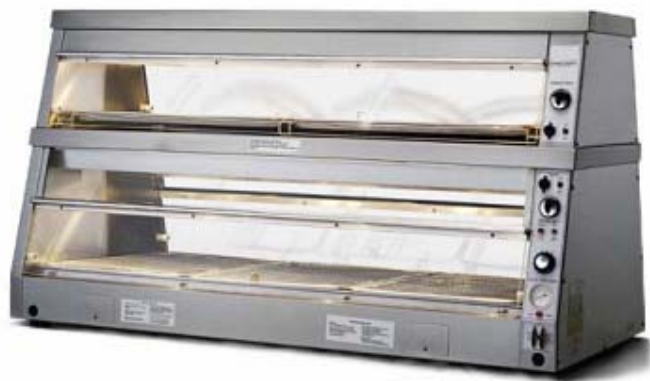
Двуетажна топла витрина, модел HCW – 5 с двустранна видимост долен етаж с поддържане на влага

Display counter warmers, Two-tier, dry over humidified